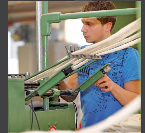
Maschinen- und Anlagenführer/-in – Textiltechnik und Textilveredlung